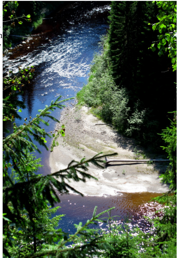
Utsikt från Nipkant